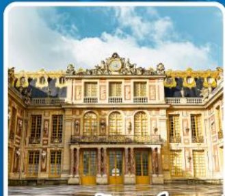
พระราชวังแวร์ซายน์