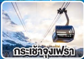
กระเช้าจุงเฟร่า