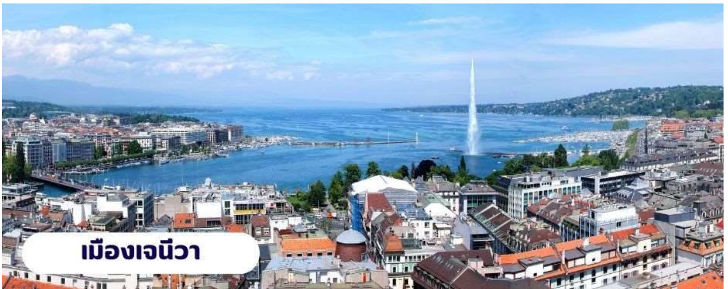
เมืองเจนีวา

13.15 น. ✈️ เดินทางถึง เมืองเจนีวา ประเทศสวิตเซอร์แลนด์ หลัง ผ่านพิธีการตรวจคนเข้าเมืองศุลกากรและรับกระเป๋า เดินทางเรียบร้อยแล้ว นำท่านชม เมืองเจนีวา เมือง ท่องเที่ยวที่มีชื่อเสียงและมีความสำคัญมากเป็นอันดับต้นๆ ของประเทศสวิตเซอร์แลนด์ ตัวเมืองนั้นตั้งอยู่บริเวณที่ ทะเลสาบเจนีวาไหลเข้ารวมกับแม่น้ำโรห์น (Rhône river) โดยทะเลสาบเจนีวานั้นตั้งอยู่ทางตะวันตกของประเทศ เป็น แหล่งน้ำจืดที่ใหญ่เป็นอันดับสองของทวีปยุโรปกลาง รอง จากทะเลสาบบาลาตันในประเทศฮังการี สำหรับกรุงเจนีวา ได้รับการยกย่องว่าเป็นเมืองนานาชาติ (Global City) เนื่องจากเป็นที่ตั้งขององค์กรระหว่างชาติสำคัญๆ หลาย องค์กร เช่น สำนักงานใหญ่ขององค์การสหประชาชาติ ประจำทวีปยุโรป, องค์การอนามัยโลก (WHO), องค์การ