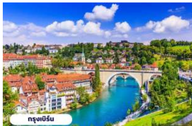
กรุงเบิร์น

๑๐ บริการอาหารเช้า ณ ห้องอาหารของโรงแรม จากนั้นนำท่านเที่ยวชมสถานที่สำคัญต่างๆในกรุงเบิร์น กรุงเบิร์นได้รับการยกย่องจากองค์การยูเนสโกให้เป็นเมืองมรดกโลก ในปี ค.ศ. 1863 นอกจากนี้เบิร์น ยังถูกจัดอันดับอยู่ใน 1 ใน 10 ของเมืองที่มีคุณภาพชีวิตที่ดีที่สุดของโลกในปี ค.ศ.