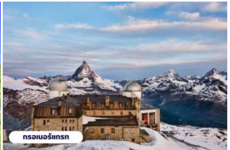
กรอเนอร์กรัท

ของการชมยอดเขาต่างๆ และเป็นจุดชม ยอดเขาแมทเธอร์ฮอร์น อีกแห่งหนึ่งที่สวยงาม อิสระให้ท่านถ่ายรูปบรรยากาศที่สวยงามแห่งนี้และสนุกสนานกับกิจกรรมบนยอดเขา ถึงเวลาอันสมควรนำท่านเดินทางกลับสู่เมืองเซอร์แมทอีกครั้งโดยรถไฟ