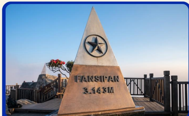
น้ิงกระเช้าสู่ยอดเขาฟานซิปัน