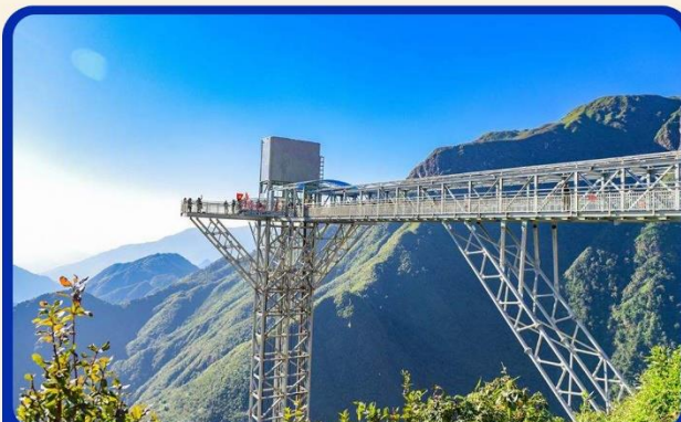
สะพานแก้วมังกรเมฆ (Rong May Glass Bridge)