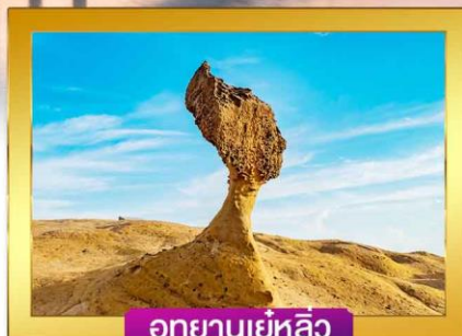
อุทยานเขี้ยว