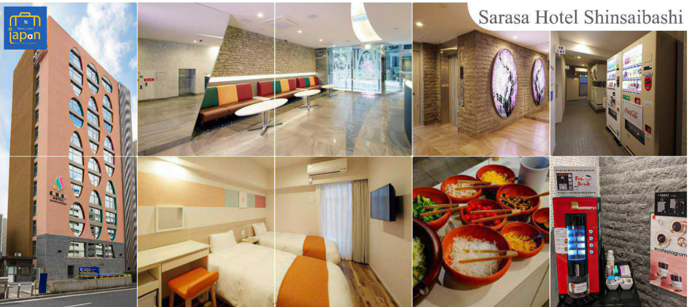
Sarasa Hotel Shinsaibashi

พักที่ SARASA HOTEL SHINSAIBASHI หรือเทียบเท่าระดับเดียวกัน