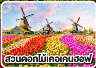
สวนดอกไม้เคอเคนฮอฟ

ดอกไม้ที่สดใส กับ หัวใจที่เบิกบาน ฝรั่งเศส เบลเยียม ลักเซมเบิร์ก เยอรมนี เนเธอร์แลนด์ 8 วัน 6 คืน