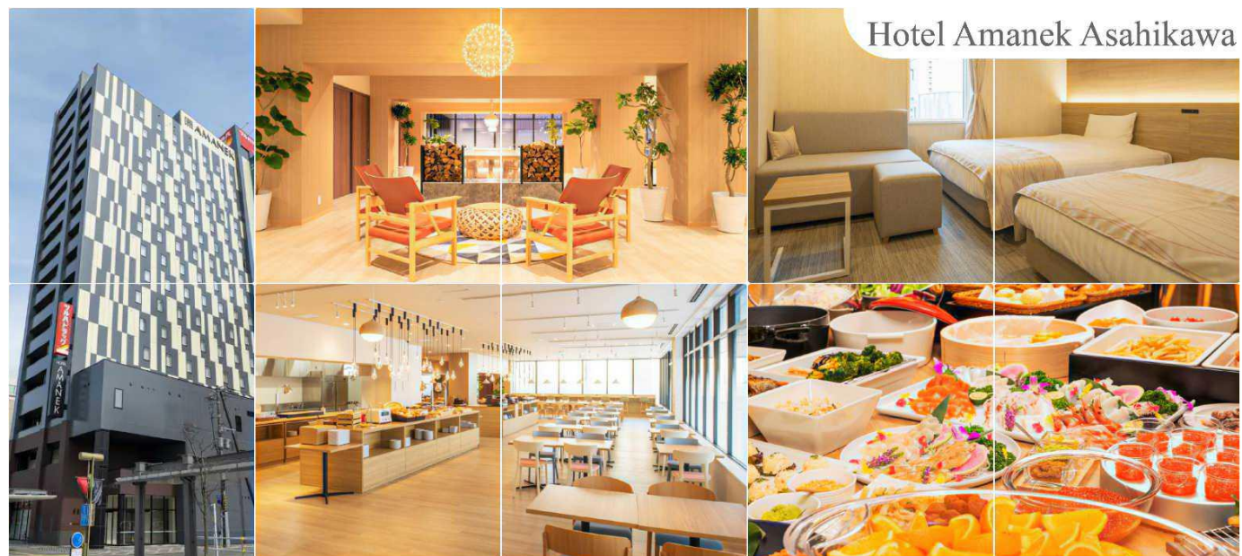
Hotel Amaneku Asahikawa

ค่าที่พัก รับประทานอาหารค่ำอิสระตามอัธยาศัย HOTEL AMANEKU ASAHIKAWA หรือระดับเดียวกัน