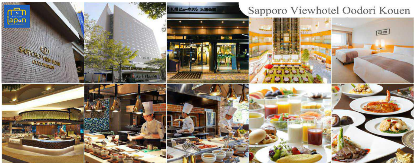
Sapporo Viewhotel Oodori Kouen

อิสระรับประทานอาหาร ณ ภัตตาคาร (2) --- บุฟเฟต์บิงย่าง + ชาบูยักษ์ SAPPORO VIEW HOTEL ODORI KOUEN หรือเทียบเท่าระดับเดียวกัน