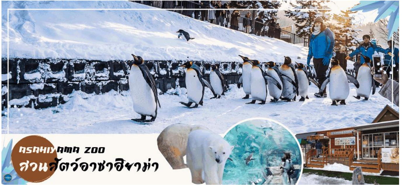
ASAHIYAMA ZOO สวนสัตว์อะซาฮิยาม่า