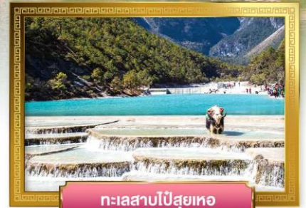
ทะเลสาบไป๋สฺยเหอ