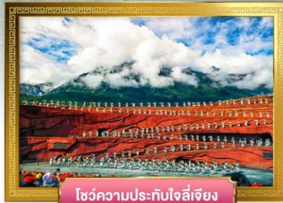
โซว์ความเร็วประทับใจลี่เจียง