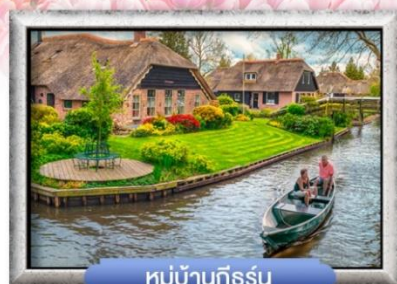
หมู่บ้านทีรูร์น

เมนู พิเศษ! หอยแมลงงูอบไวน์ขาว, ล่องเรือหลังคากะจก