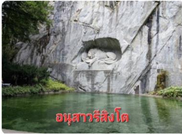
อนุสาวรีย์สิงโต