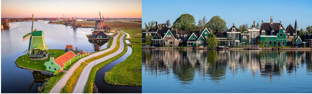
เนเธอร์แลนด์เก็บไว้เป็นที่ระลึก

นำท่านเดินทางสู่ หมู่บ้านซานสแกน (ZAANSE SCHANS) ให้ท่านได้ถ่ายรูปสัญลักษณ์ของประเทศ