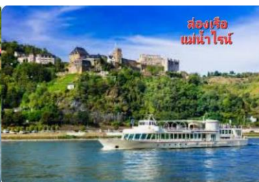
ล่องเรือ แม่น้ำไรน์

นำท่านออกเดินทางสู่ ท่าเรือเมืองบอบปาร์ด เมืองเล็กๆที่สวยงามริมแม่น้ำไรน์ เพื่อนำท่าน ล่องเรือชมความงดงามสองฝั่งของแม่น้ำไรน์ไม่ว่าจะเป็นปราสาทต่างๆบนเนินเขา ด้านเก็บภาษีกลางแม่น้ำไรน์ในสมัยโบราณ ผ่านหน้าผาหินที่ชื่อว่า ลอเลอไรน์