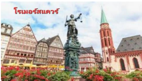
โรเมอร์สแควร์

นำท่านเดินทางสู่ เมืองแฟรงเฟิร์ต (FRANKFURT) เมืองเศรษฐกิจของเยอรมัน ...นำท่านถ่ายรูปกับตัวอาคาร