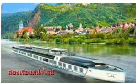
ล่องเรือแม่น้ำไรน์