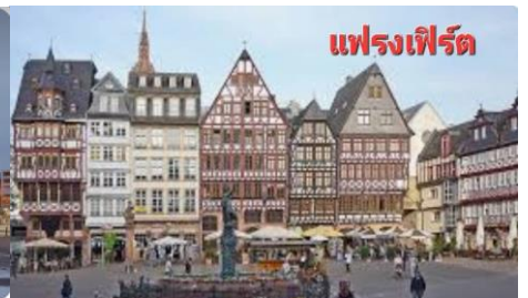
แฟรงเฟิร์ต

โรเมอร์ ย่านโรเมอร์สแควร์ ศาลาว่าการเมืองแฟรงเฟิร์ต แฟรงเฟิร์ตโดม และเดินทางไปยังบริเวณริมแม่น้ำไมน์ ถ่ายรูปกับวิวอันงดงามริมแม่น้ำ ถ่ายรูปกับโบสถ์เซนต์ปอล และ โบสถ์เซนต์นิโคลาส