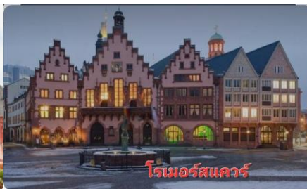
โรเมอร์สแควร์