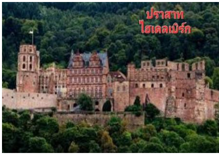
ปราสาท ไฮเดลเบิร์ก