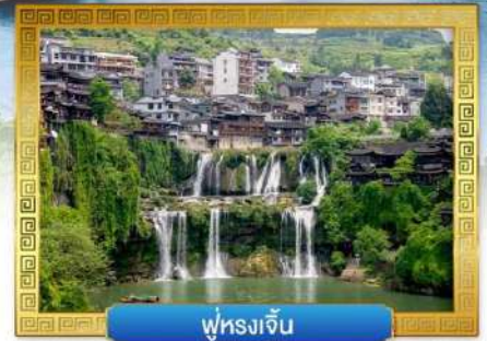
พู๋หลงเจิ้น