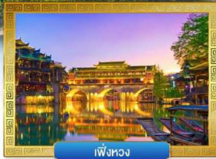
เฟิ่งหวง