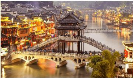
เมืองเฟิ่งหวง