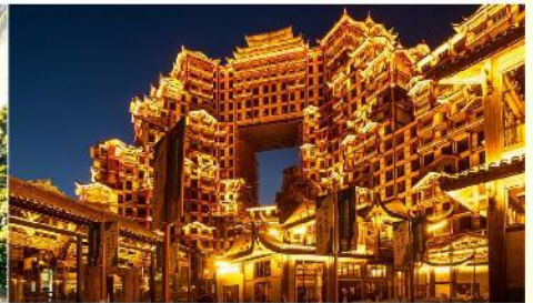
ตึก 72 ชั้น

*ทางบริษัทฯ ขอสงวนสิทธิ์ในการสลับโปรแกรมทัวร์ตามความเหมาะสมขึ้นอยู่กับสถานการณ์หน้างาน โดยคำนึงถึงผลประโยชน์ของลูกค้าเป็นสำคัญ