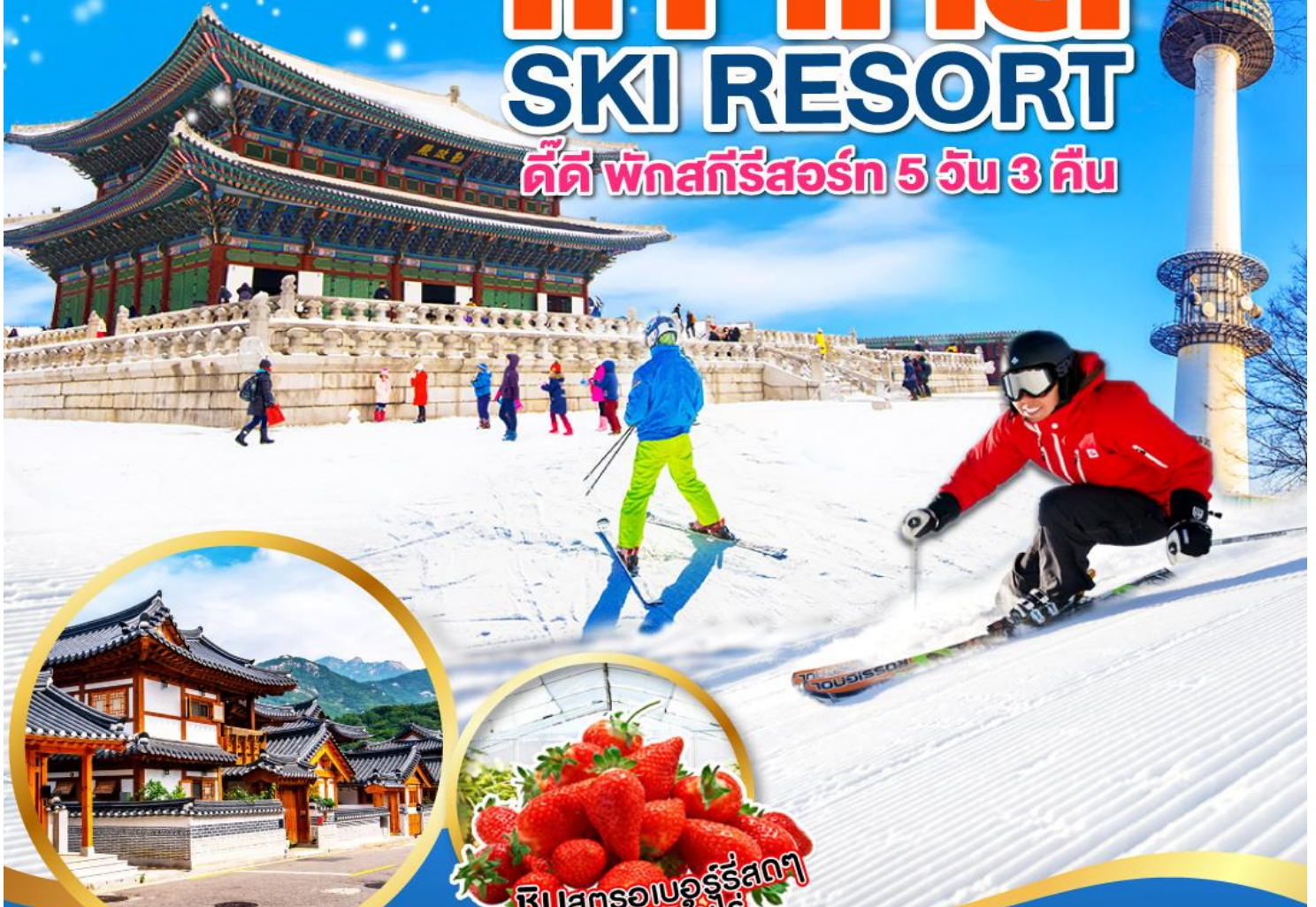
หมู่บ้านโบราณอันพยอง