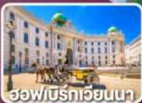
ฮอฟเบิร์กเวียนนา

ตามรอยซีรีส์ Crash Landing on you ที่ทะเลสาบเบรียนซ์