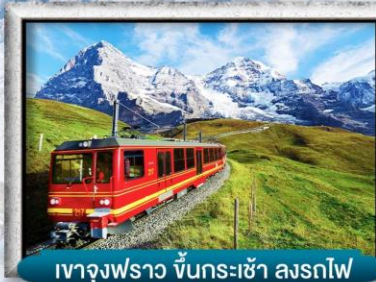
เขาจุงเฟร่า ขึ้นกระเช้า ลงรถไฟ