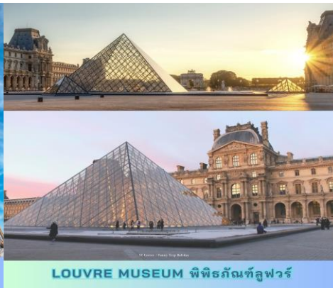
LOUVRE MUSEUM พิพิธภัณฑ์ลูฟวร์