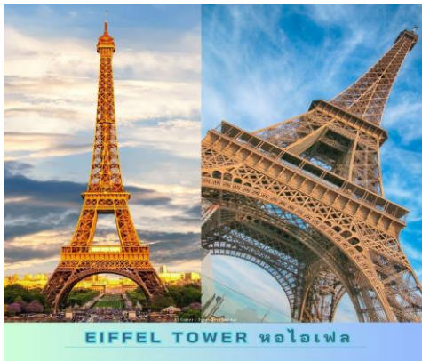
EIFFEL TOWER หอไอเฟล

นำท่าน ชมหอไอเฟล (EIFFEL TOWER) ซึ่งเป็นสัญลักษณ์ของกรุงปารีส เลิศหรู อลังการ โรแมนติก มหัตศจรรย์ ด้วย ความสูง 984 ฟุต สร้างด้วยโครงเหล็กทั้งหมด...ถนนชองเซลีเซ (CHAMPS-ELYSEES) ถนนที่มีต้นไม้เรียงรายทั้งสอง ข้างทางอย่างน่าเดินเล่น ต้นแบบถนนราชดำเนิน ปลัซเดอลา คอนคอร์ด (PLACE DE LA CONCORDE) จัดรูัสแห่ง ความสามัคคี โบสถ์แมตติแลน ที่สร้างแบบกรีกโบราณ ถ่ายรูปกับปิระมิดหน้าพิพิธภัณฑ์ลูฟวร์ หรืออดีตพระราชวังลูฟวร์ จากนั้นนำท่าน ชมเมืองปารีส มหาราชินีแห่งเมืองหลวงของโลก ..ถ่ายรูปคู่กับประตูชัย (ARC DE TRIOMPHE) ของ พระเจ้าโปเลียนอาร์ค เดอทรูอุม ให้ท่านช้อปปิ้งสินค้าแบรนด์เนมที่มีชื่อเสียง ณ ห้างแกลอรี่ลาฟาแยส เช่น หลุยส์, พราด้า, กูชชี, ซาแนล, เฟนดิก, นาฬิกา, น้ำหอม, เครื่องสำอาง ฯลฯ