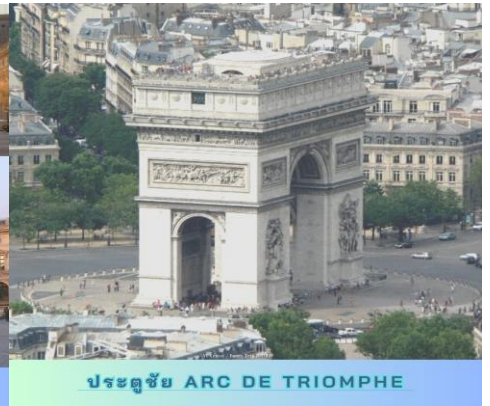
ประตูชัย ARC DE TRIOMPHE

ค่ำ รับประทานอาหารค่ำ ณ ภัตตาคาร (หอยแอสคาร์โกร, สเต็ก, ไวน์)