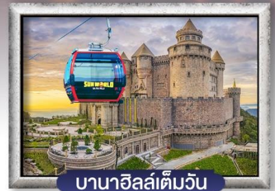
บาน่าฮิลล์เต็มวัน