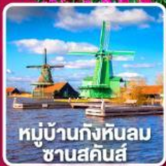
หมู่บ้านกังหันลม ซานสคินส์

เข้าชมเทศกาล สวนดอกไม้เคอเคนฮอฟ 1 ปีมีครั้งเดียว