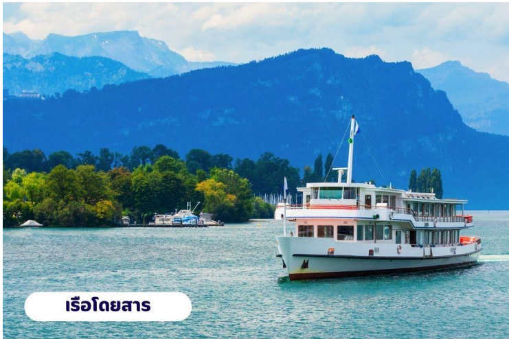
เรือโดยสาร

🕒 บริการอาหารเช้า ณ ห้องอาหารของโรงแรม จากนั้นนำท่านเดินทางสู่ ยอดเขาริกิ (Rigi Kulm) โดยใช้บริการเดินทางโดยเรือจากทะเลสาบลูเซิร์นไปยังท่าเรือวิทซ์เนา (Vitzanu) จากนั้นนั่งรถไฟไต่เขา Rigi ถือได้ว่าเป็นรถไฟไต่เขาที่เก่าแก่ที่สุดในยุโรป และยังเป็นอันดับ 2 รองจากยอดเขาวอชิงตัน ในมลรัฐนิวแฮมป์เชียร์ สหรัฐอเมริกา ความสูงจากระดับน้ำทะเล 1,797 เมตร จนมาถึงยอดเขาริกิ (Rigi Kulm) ชื่อนี้มีที่มาจากคำว่า Mons Regina แปลได้ว่าราชินีแห่งภูเขา เพราะสามารถมองเห็นทิวทัศน์ของยอดเขาอื่นๆ ได้รอบ 360 องศา ชมวิวแบบพาโนรามาโอบล้อมด้วยธรรมชาติของทะเลสาบ Luzern และ Zug อิสระทุกท่านถ่ายรูปชมวิวดตามอัธยาศัย