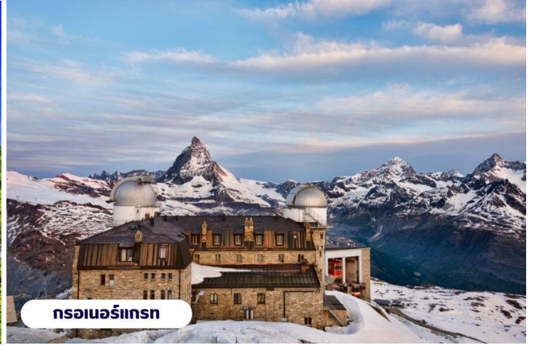
กรอเนอร์กรัท